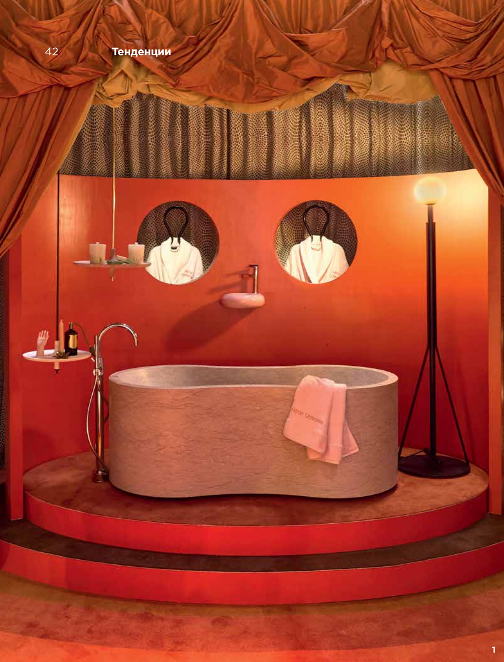
1. ИНСТАЛЛЯЦИЯ HÔTEL UCHRONIA НА ВЫСТАВКЕ MAISON&OBJET. СПА-ЗОНА. 2. КОВРИК ДЛЯ ЙОГИ, UCHRONIA ДЛЯ HERCULE STUDIO. 3. ПРОЕКТ UCHRONIA ДЛЯ ТЕКСТИЛЬНОЙ МАНУФАКТУРЫ PRELLE.