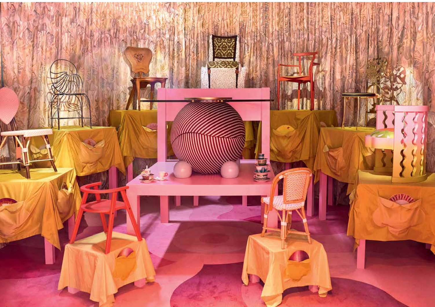
ИНСТАЛЛЯЦИЯ HÔTEL UCHRONIA НА ВЫСТАВКЕ MAISON&OBJET. ФРАГМЕНТЫ.